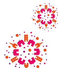
Steffen Ball Bürgermeister